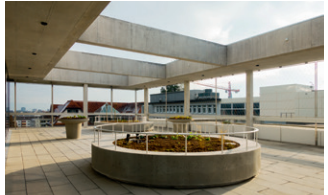
Offenes Dach mit Blumenrabatte.