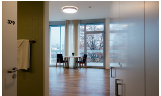
Blick in ein Zimmer, wo Holztöne vorherrschen.