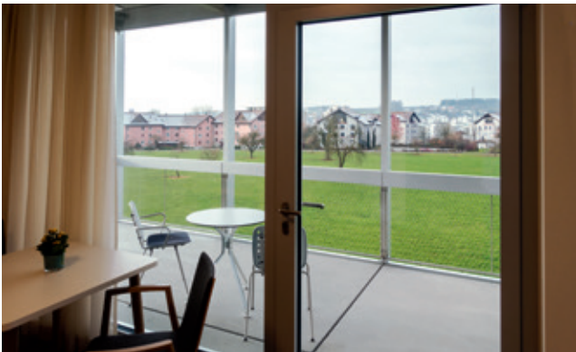
Tolle Aussicht ins Grüne.