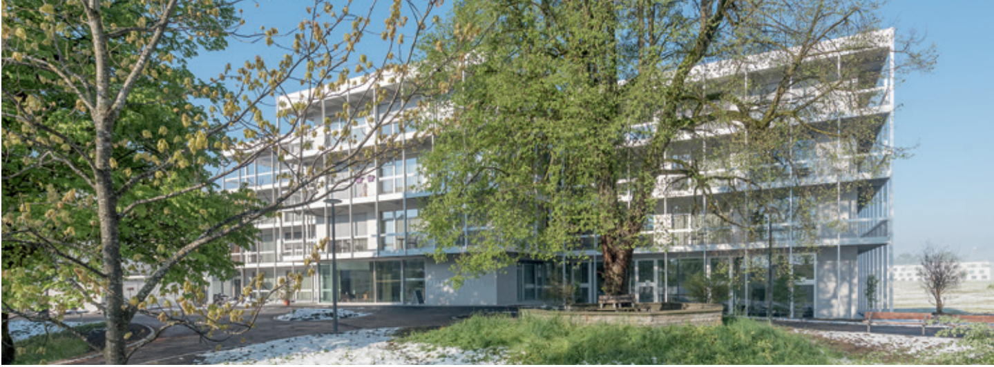
Blick auf die Ostfassade des Erweiterungsbaus.