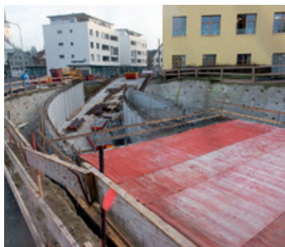
Die Rampe zur Tiefgarage im Bau.

Bei den Alimenten-Bevorschussungen wurde auch im Jahr 2016 eine leichte Zunahme registriert. Dies rührt daher, dass die betroffenen Personen bei Scheidungen oder Trennungen ihren Zahlungsverpflichtungen nicht mehr nachkommen können.