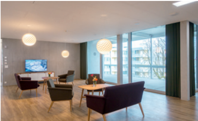
Wohlige Atmosphäre im Aufenthaltsraum.