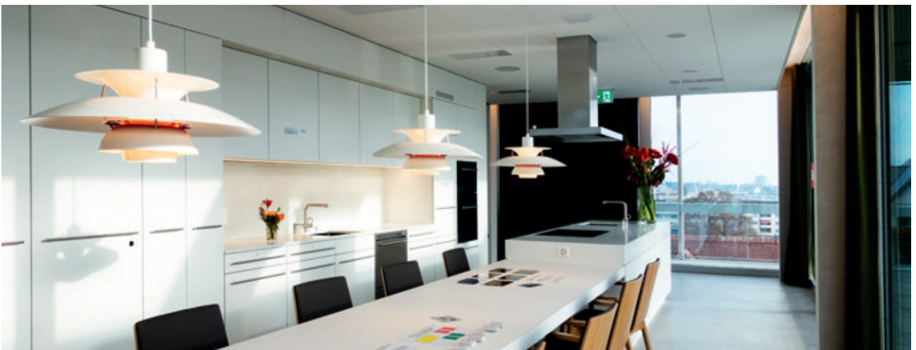
Aufenthalt in der Gemeinschaftsküche.