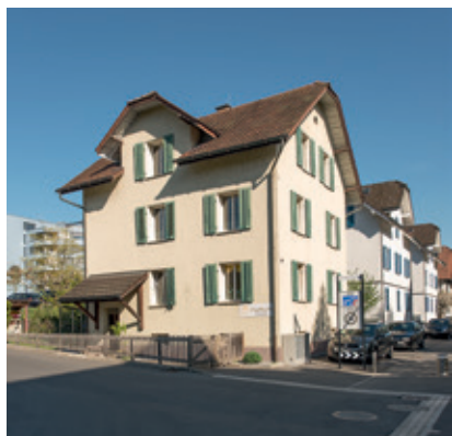
Liegenschaft Rigistrasse 7: Pläne für einen Neubau.