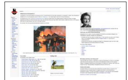
Startseite von chamapedia.ch