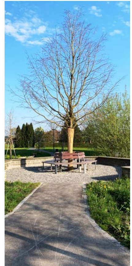
Die neu gepflanzte Linde beim Vorplatz des Pflegezentrums.

Erfreulich ist auch das Interesse an diesem Nachschlagewerk. Die Startseite wurde seit der Lancierung dieses Online-Portals am 21. November 2016 mehr als 180'000 Mal aufgerufen, das heisst täglich rund 200 Mal aufgerufen.