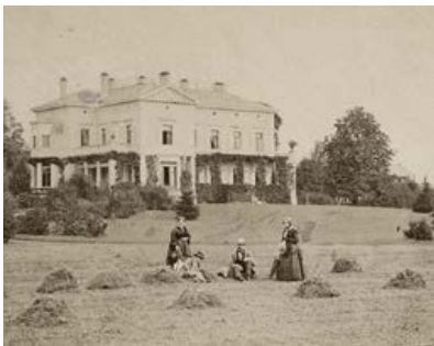
Die Villa Villetta um 1866, kurz nach ihrer Fertigstellung.

https://www.chamapedia.ch/wiki/Villetta,_Villa_Villetta