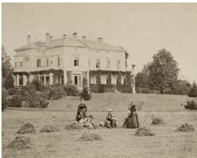
Die Villa Villetta um 1866, kurz nach ihrer Fertigstellung.