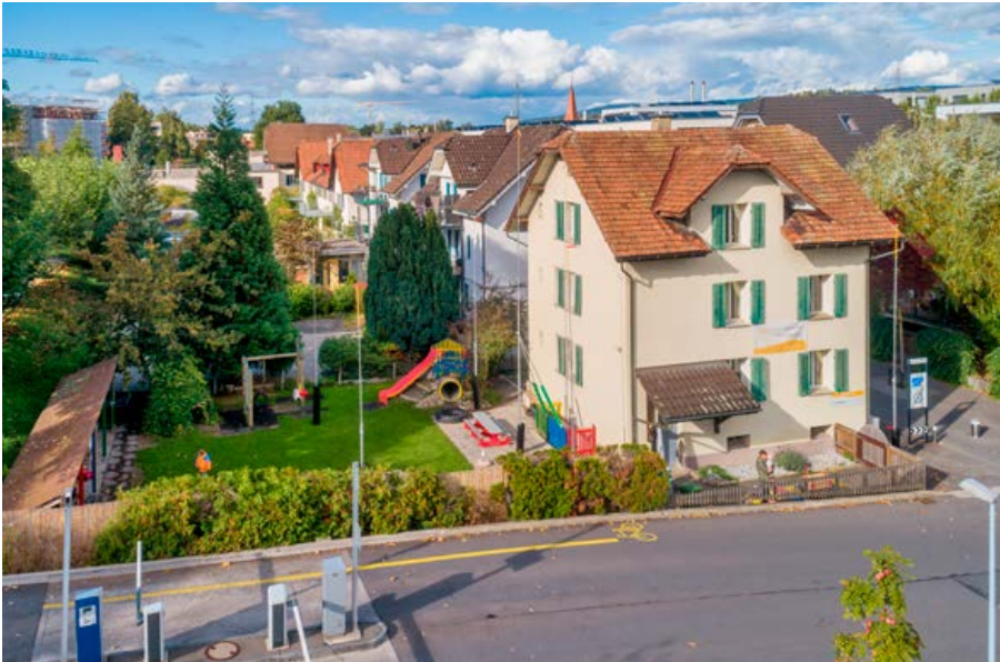
Die Liegenschaft Rigistrasse 7 weicht einem Neubau.