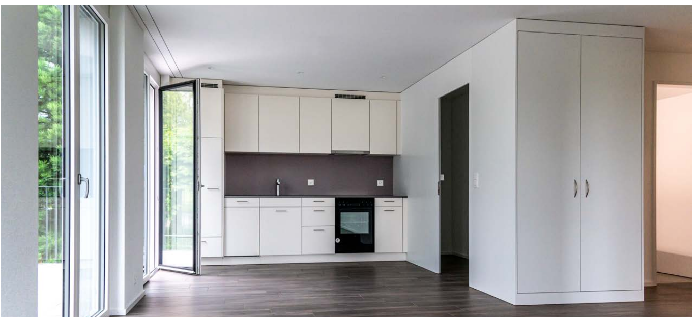
Wohnraum und Küche der 2,5-Zimmer-Wohnung