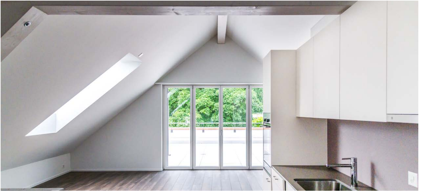
Wohnraum und Küche im Dachgeschoss