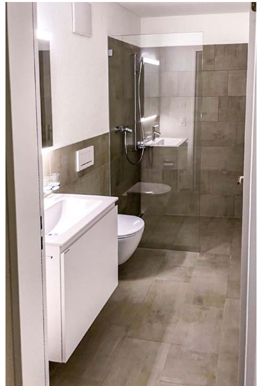
Dusche / WC