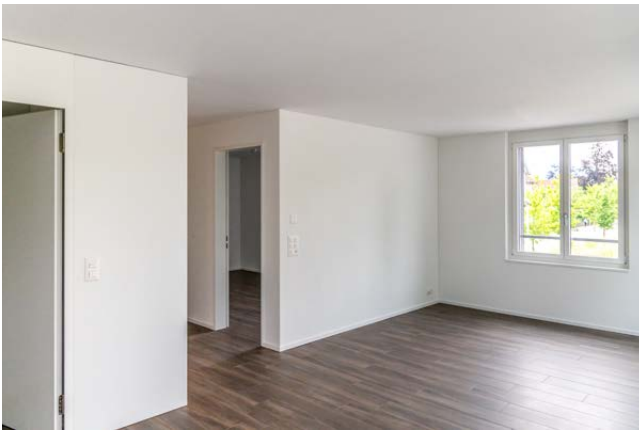
Wohnraum der 2,5-Zimmer-Wohnung