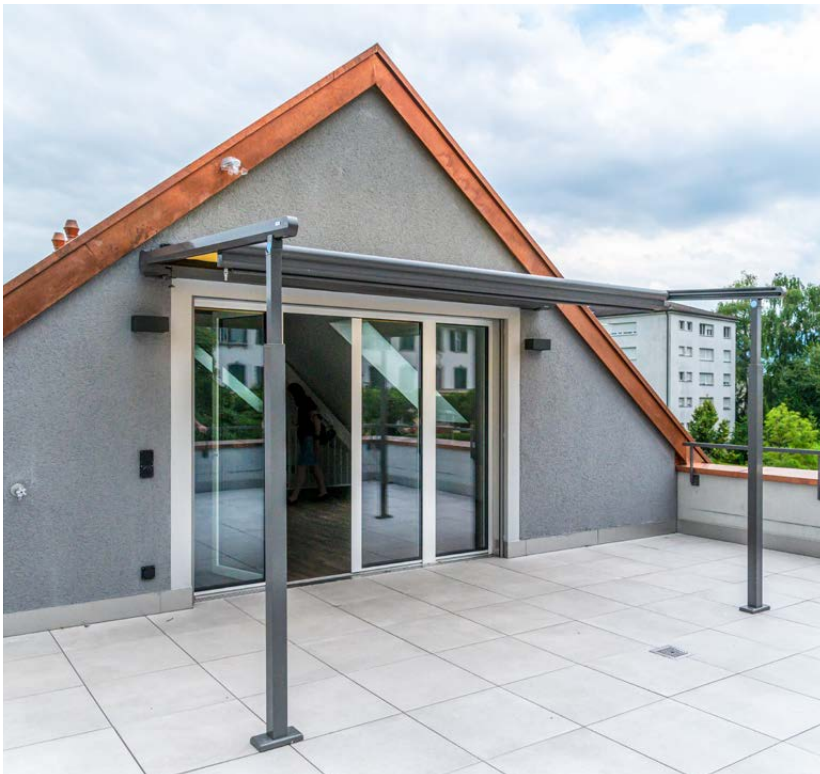
Terrasse des Dachgeschosses